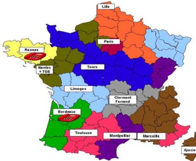
Les CGR en métropole

En termes d'organisation l'année 2011 a marqué un grand pas avec la consolidation du réseau des centres de gestion des retraites et la mise en place d'un guichet unique pour renseigner l'utilisateur et simplifier ses démarches. Le resserrement du réseau des centres de gestion s'est traduit par une modification de la cartographie, avec 12 centres de gestion des retraites (CGR) en France métropolitaine dont 2 sont des centres de services retraite (CSR) situés à Rennes et à Bordeaux et disposant d'un numéro d'appel unique. Désormais l'utilisateur pensionné, par le numéro d'appel unique (0810 10 33 35) peut obtenir une réponse à ses premières interrogations qui, si elles s'avèrent complexes peuvent être relayées au SRE ou au centre de gestion des retraites géographiquement compétent lorsqu'elles sont relatives au paiement.